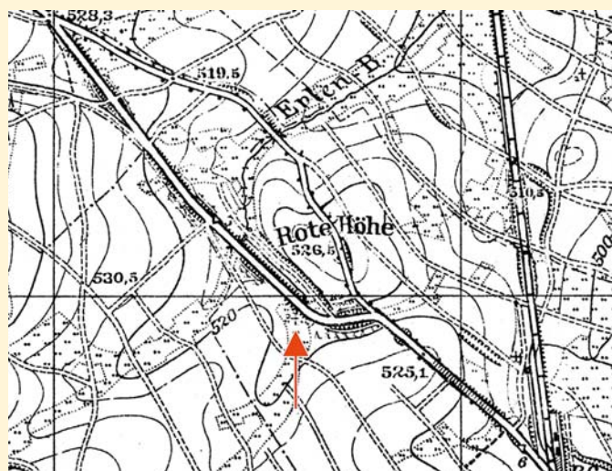
Fragment przedwojennej mapy topograficznej z zaznaczoną kapliczką przydrożną w sąsiedztwie góry Rudna