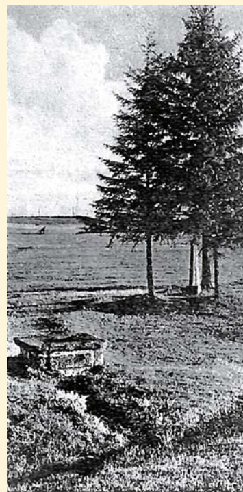
Przedwojenne zdjęcie ukazujące Dobre Źródło wraz ze stojącą obok kapliczką.

„W dniu 22 lipca 1739 roku udałem się z miejscowym lekarzem do Chełmska Śląskiego, aby zobaczyć tak zwane Dobre czy też Święte Źródło, gdzie wielu ludzi przychodziło od jakiegoś czasu, aby używać tej wody dla poprawy swojego zdrowia. Kiedy przybyłem na miejsce, spotkałem tam różnych ludzi, sam napiłem się wody, napełniłem kilka butelek i zabrałem je ze sobą, by wypróbować ją w tutejszej aptece przyklasztornej i zobaczyć, jaki przynosi efekt. Według przekazów ludowych studnia wytrysnęła o jedenastej w południe, kiedy pasterz z folwarku chełmskiego wypasał swoje owce i zobaczył, że woda wypływa łukiem niczym rura. Umył