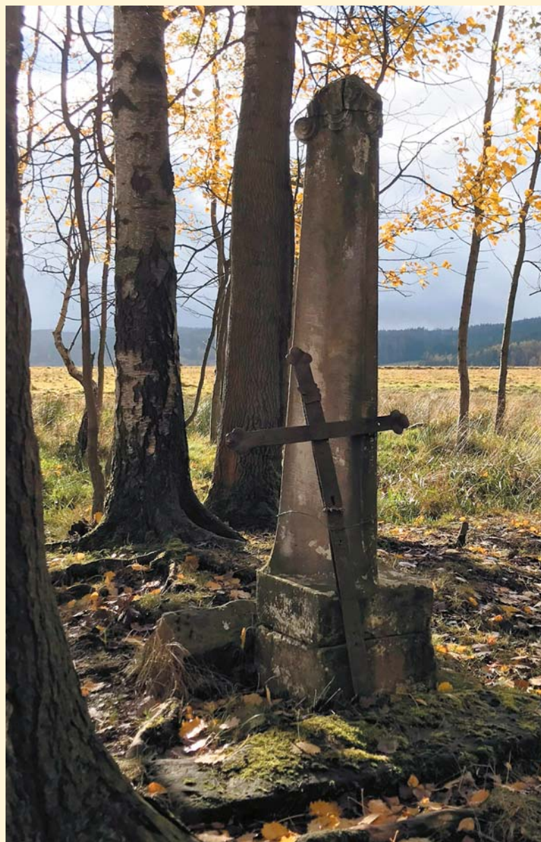
Kapliczka z opartym krzyżem. Wszystkie współczesne fotografie: Marian Gabrowski, październik 2023 roku

Kiedy w latach osiemdziesiątych ubiegłego wieku wybudowano drogę z Lubawki do Chełmska Śląskiego i w tym celu wzniesiono wysoki nasyp drogowy, nasyp ten zablokował odpływ wody źródlanej. Dlatego łąka stała się podmokła, ale źródło zachowało