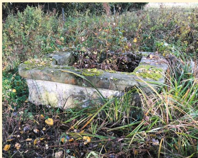
Kamienna obudowa Dobrego Źródła